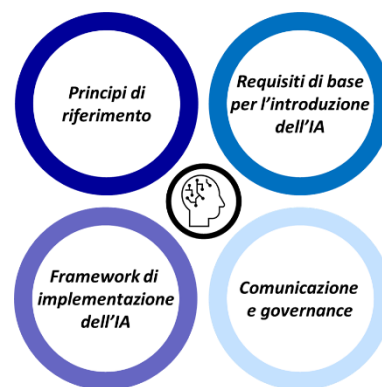
Figura 1 - I pilastri alla base del modello di introduzione dell'IA nelle scuole