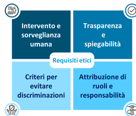
Figura 3 - I requisiti etici per l'utilizzo dell'IA

L'utilizzo sempre più consistente dell'IA nel mondo scuola solleva importanti implicazioni etiche che devono essere affrontate con attenzione per assicurare un impatto positivo e sostenibile, in linea con i principi trainanti le azioni del Ministero. È perciò fondamentale utilizzare tale strumento in modo da assicurare il rispetto di norme e principi etici, così che l'IA possa rappresentare uno strumento affidabile e inclusivo al servizio della comunità scolastica.