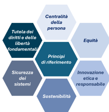
Figura 2 - I principi fondanti della strategia per l'introduzione dell'IA

La strategia per l'introduzione dell'IA è guidata dai seguenti principi di riferimento che costituiscono il fondamento delle politiche e delle azioni intraprese dal Ministero per affrontare con decisione e responsabilità le sfide del futuro, in coerenza con i valori costituzionali, a partire da quelli riconosciuti negli articoli 2 e 3 Cost., delineati ed ulteriormente articolati nelle politiche educative nazionali (art. 9, comma 1 Cost.) ed europee (art. 14 Carta dei diritti fondamentali dell'UE) 3 .